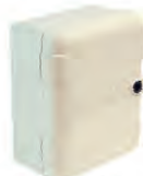
HUIZING MOD. L