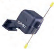
PLUS 1 868