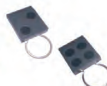
T 2 - T 4 868 SLH

Met de kaart MIXER is het mogelijk twee lezers, eventueel met verschillende technologieën, op dezelfde ingang van de VIPER 400 te combineren.