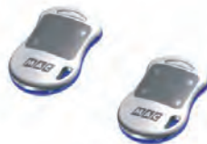
TX 2 mini - TX 4 mini 868 SLH